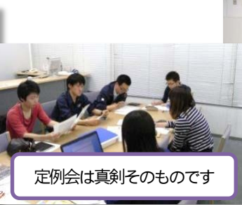
定例会は真剣そのものです