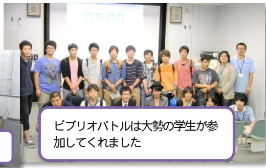
ビブリオバトルは大勢の学生が参加してくれました