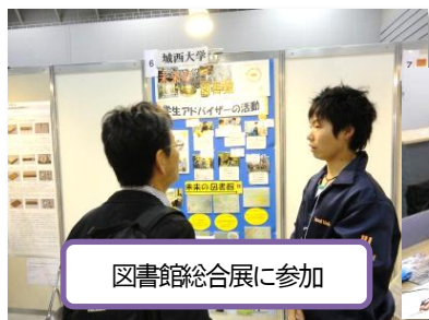
図書館総合展に参加

第2期である今年度は、学習支援のみならず、ビブリオバトルの運営や図書館総合展にてポスターセッションに参加するなど外部へ向けた図書館広報にも挑戦しました。