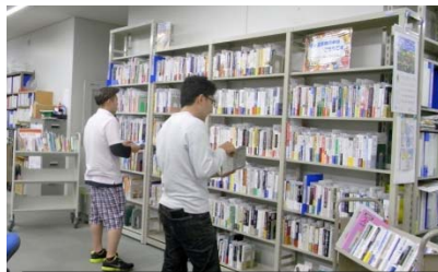
熱心に選書してくれました

現在、図書館1階の階段わきのミニ展示コーナーで、選書理由のコメント付きで公開しています。ぜひ手にとって読んでみてください。