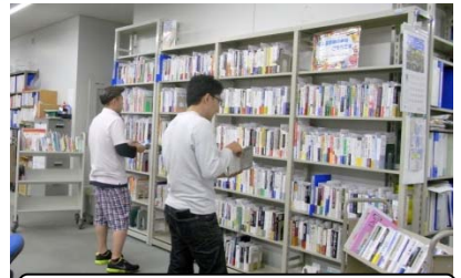
熱心に選書してくれました

現在、図書館1階の階段わきのミニ展示コーナーで、選書理由のコメント付きで公開しています。ぜひ手にとって読んでみてください。