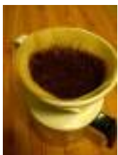
中挽きの粉を平らに (中央を軽く窪ませ) 入れる