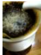
中心から静かに湯をそそぐ (「の」の字を描くように)